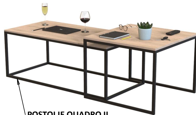
POSTOLJE QUADRO II □ 1200 x 600 H=450 mm