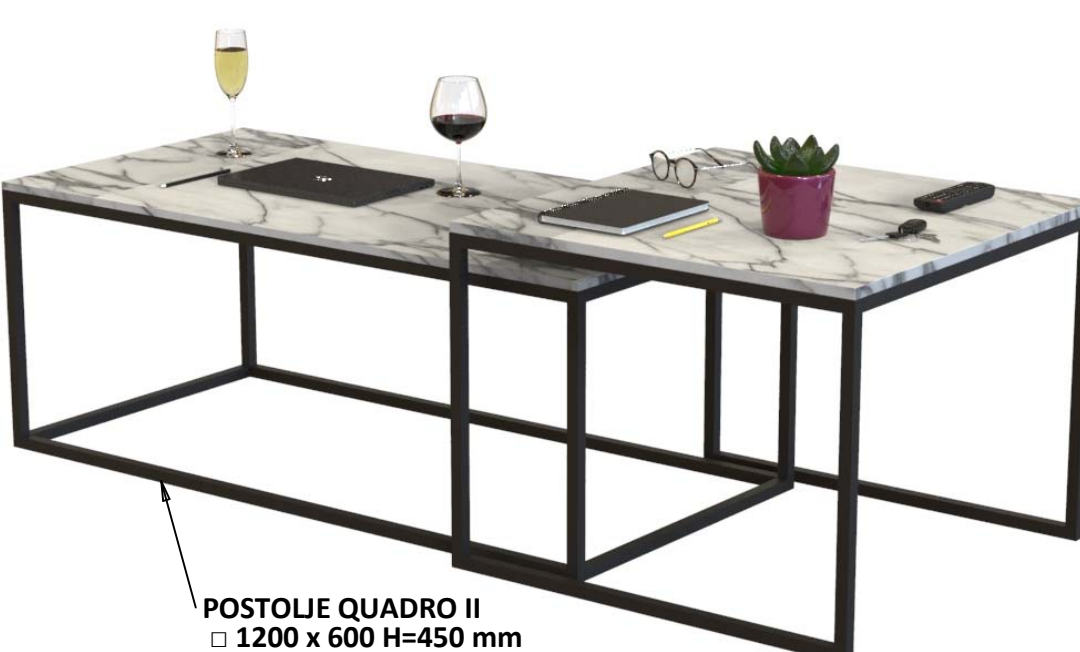
POSTOLJE QUADRO II □ 1200 x 600 H=450 mm

Napomena : - u navedene cijene uključeni samo metalni dijelovi !!!! - pakovanje industrijsko na paletu